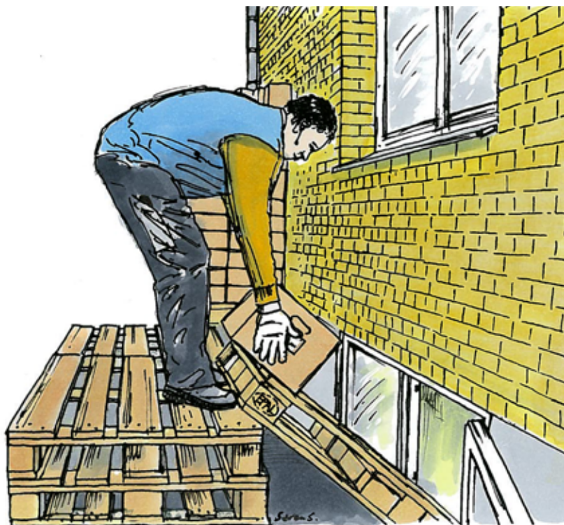
Uhensigtsmæssig aflevering af bageriprodukter.