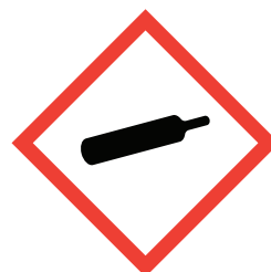
Gas under tryk