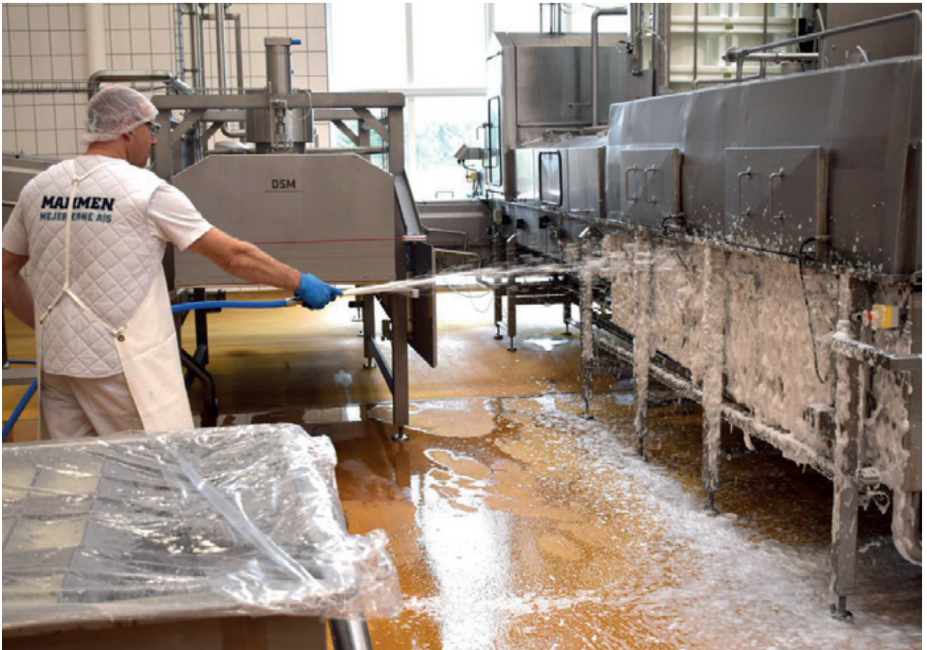
Pålægning af skum

Ved manuel pålægning af skum pålægges skummet nedefra og op på de overflader, der skal rengøres.