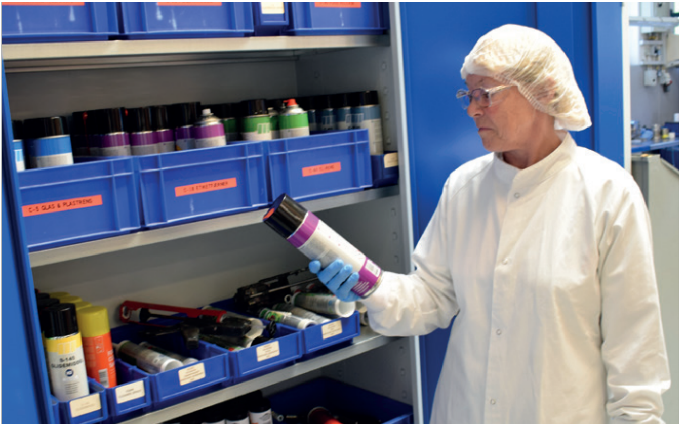
Forskellige sprayprodukter i værkstedet, der ved brug på større overflader kan danne aerosoler.

Ved svejseprocesser, herunder også for- og efterbehandling af emnerne med kemiske produkter, kan der dannes partikler, gasser og aerosoler og ved brug af køle- og smøremidler ved fx drejning, boring, fræsning, høvling og slibning kan der også dannes fx små partikler og olietågeaerosoler.