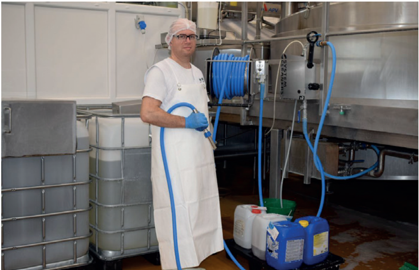
Doseringsanlæg med skumrengøringsprodukter

En undersøgelse fra slagteriindustrien, hvor der også arbejdes med skumrengøring viser, at de indholdsstoffer i skummet (sæben), der har den væsentligste betydning for påvirkning ved indånding, er syrer og baser. Derfor bør man, hvis det er muligt, undgå disse og desuden anvende rengøringsmidler, som også i brugsopløsningen har den lavest mulige faremærkning.