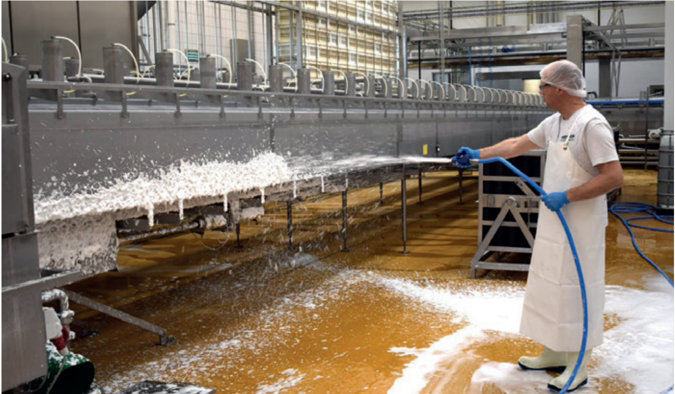
Udvendig skumrengøring af efterpresser

I mejeriindustrien kan der i forbindelse med forskellige arbejdsopgaver dannes aerosoler. Ved udvendig skumrengøring af forskellige overflader, fx tanke og rørsystemer og andet udstyr i produktionen og i skummesalen, kan der dannes aerosoler ved pålægningen af skumproduktet samt ved den efterfølgende afskylning af skummet med vand.