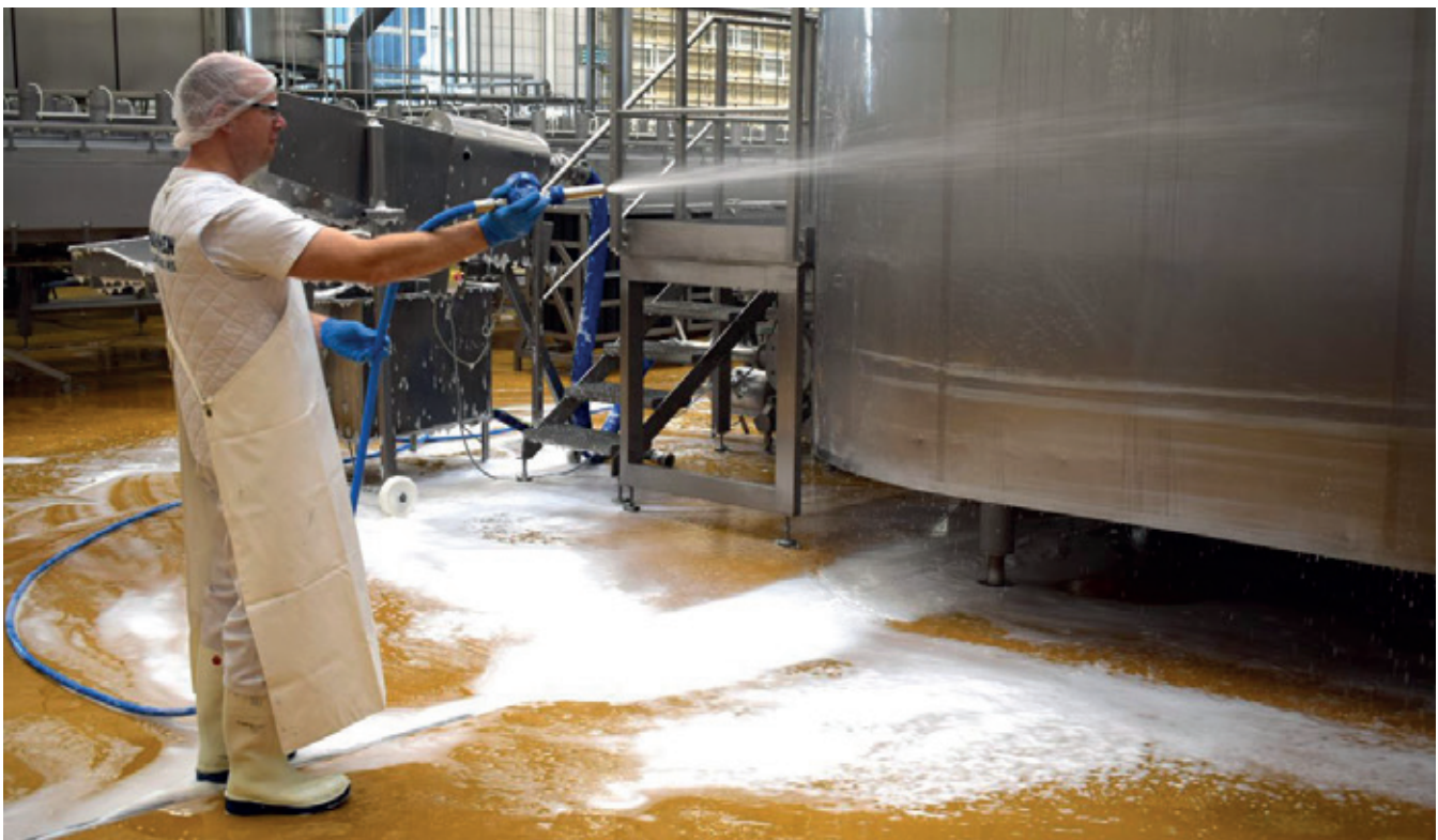
Udvendig skumrengøring af en tank