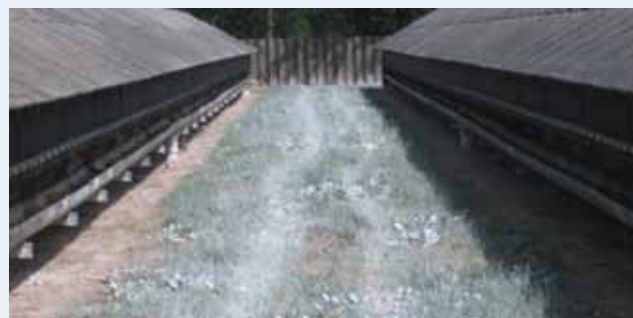
Kalkdesinficeret jord efter rengøring.

Plasmacytoseramte farme og pelsrier pålægges offentligt tilsyn, herunder rengøring og desinfektion. Farmen skal desinficeres to gange med mindst en uges mellemrum. Rengøring og desinfektion skal godkendes af fødevareregionen. Der skal foreligge dokumentation for, hvilket middel der er benyttet til desinfektionen, udetemperaturen den dag, der blev desinficeret, påføringsmetode, samt navn på de personer, der udførte denne.