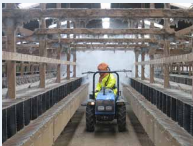
Jorden/gulvet i et minkhus kan desinficeres med hydratkalk.