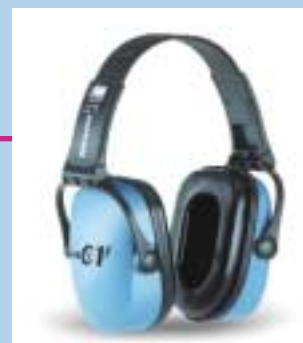
1 Normalt standard høreværn.

Ørekopper slides, bøjlen kan blive slap og tætningsringen kan ødelægges. Høreværn skal være velholdte og de skal altid bæres, når støjen er der.