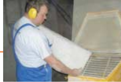
Tømning af sækkevarer i mølleri