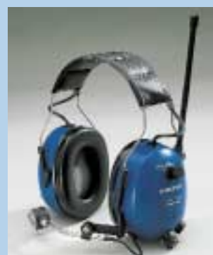
5 Headset. Forskellige former for kommunikationsudstyr kan indbygges i høreværn. Anvendes mest til specielle formål.