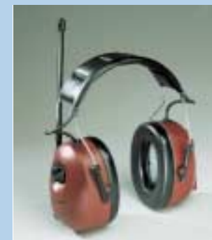
4 Høreværn med radio. For mange er det motiverende at have radio i høreværnet, så kan man høre radio samtidig med at man beskytter sig. Radioen kan normalt højst skrues op på 82 dB(A).