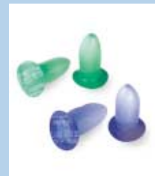
6 Ørepropper anbringes i øregangen. De kan ikke anbefales til normal daglig beskyttelse i landbruget.