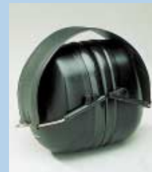
2 Sammenklappelige ørekopper. Kan foldes sammen og hænges i bæltet. Så de altid er indenfor rækkevidde, når man har brug for dem.